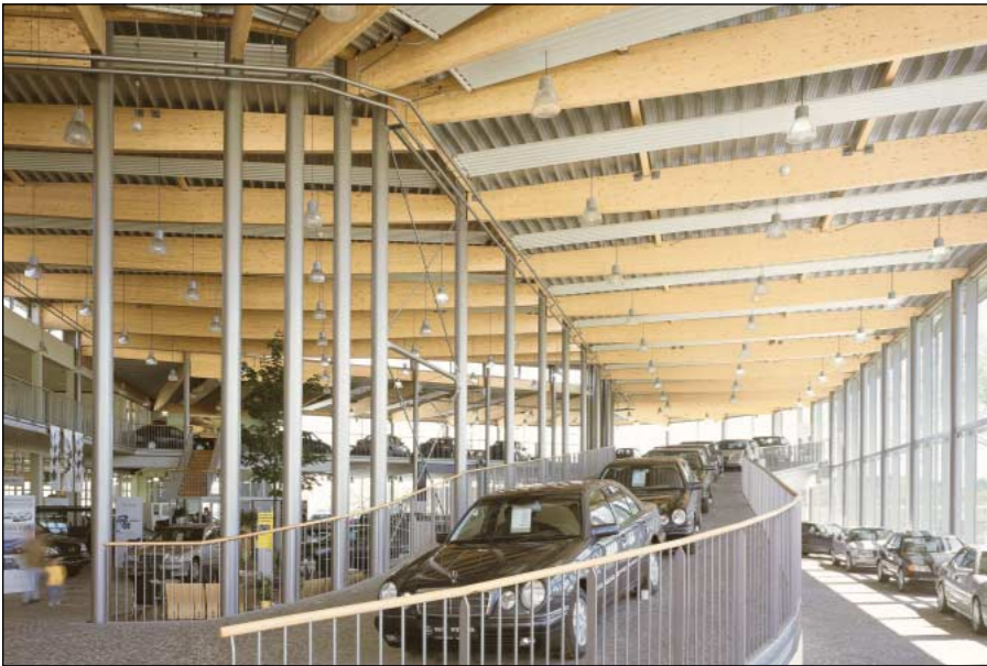
Autohaus Witteler · Brilon

Hüttemann Ingenieurholz ist der Begriff für hochwertigen Holzbau. Freigespannte Brett-schichtholz-Konstruktionen erlauben eine große Gestaltungsvielfalt und Flexibilität. Längen bis zu 50 m sind möglich.