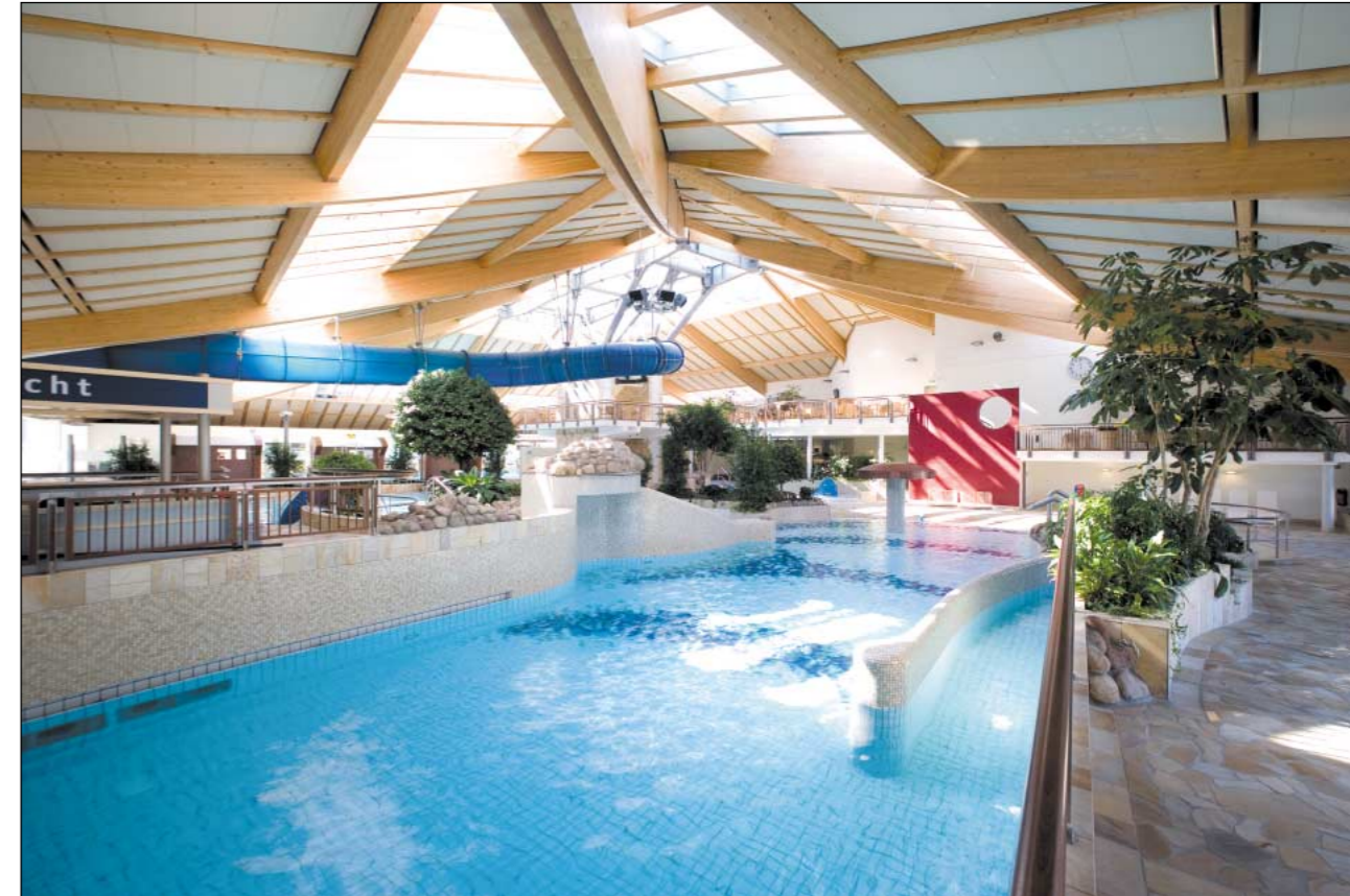
Aqua Fun · Soest