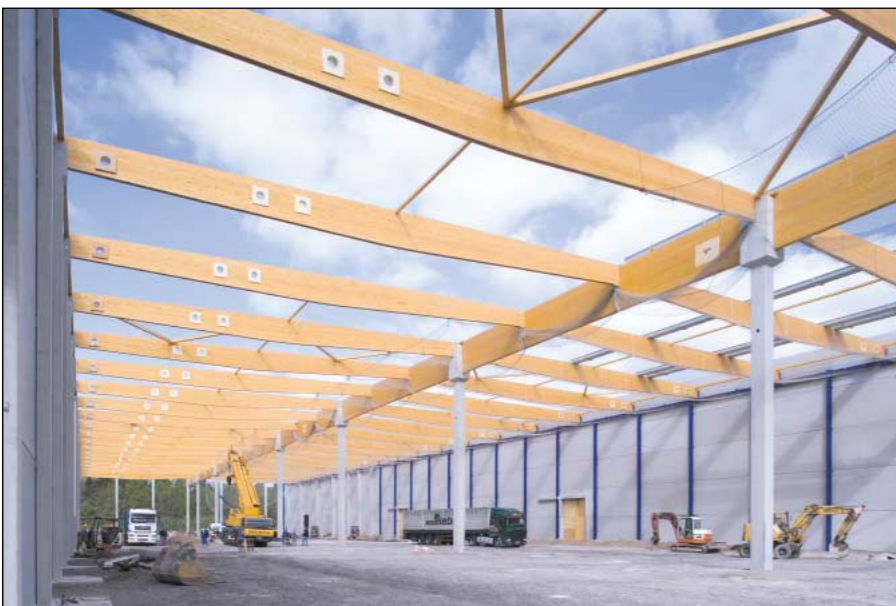
Rhenus Logistikzentrum · Giessen