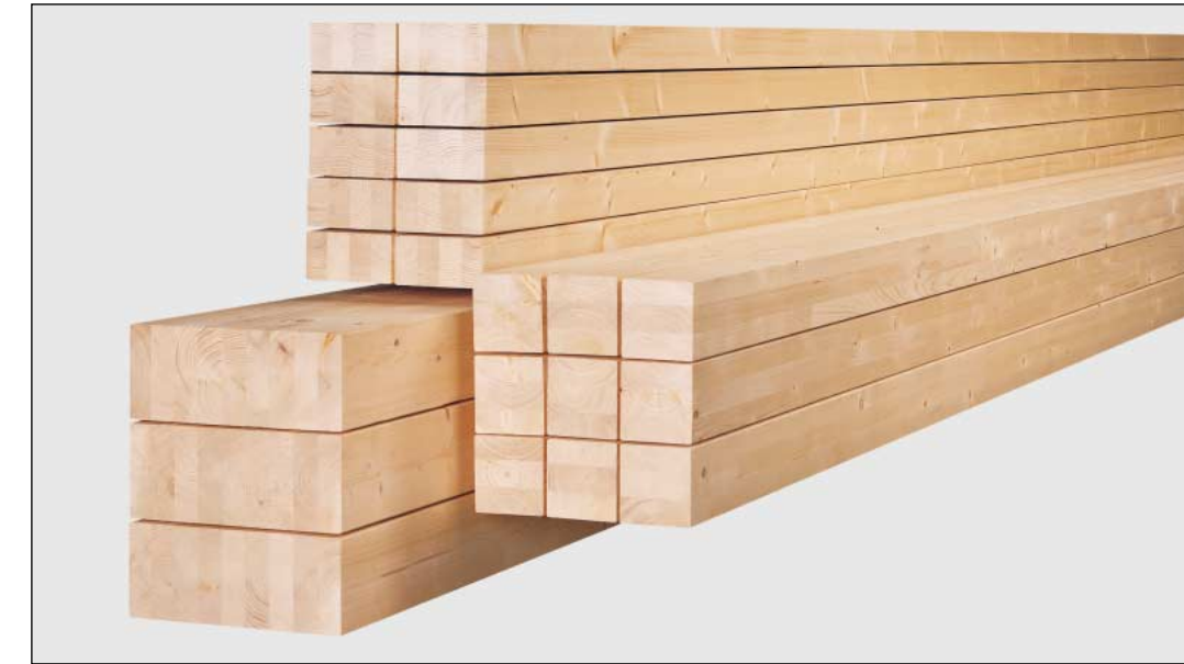
Lagerware in 10, 12, 14, 16, 18 m Länge Querschnitte von 6/12 bis 20/44 cm