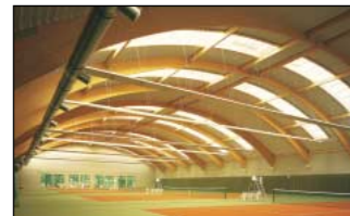
Brettschichtholz (BSH) konstruktiv/Sonderformen • Ingenieurholz und Standardhallen