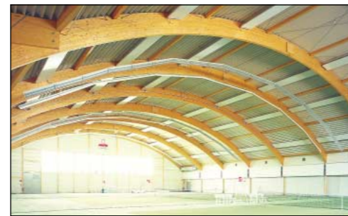
Tennishalle · Sportzentrum Herrenkrug

Auf Wunsch bieten wir Ihnen teil- oder schlüsselfertige Baumaßnahmen an.