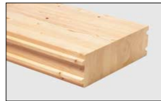
Massiver Baustoffe im Haus- und Gewerbebau aus BSH • Brettschichtholz-Elemente (HBE)