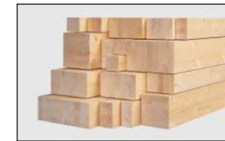
Brettschichtholz (BSH) parallel • Meisterholz

Das 1999 gegründete Werk in Wismar fertigt auf einer Fläche von 152.000 m 2 paralleles Brettschichtholz.