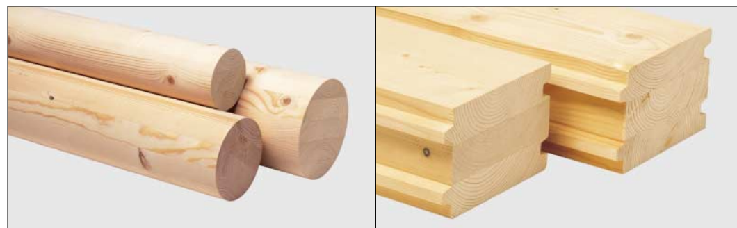
BSH-Rundsäulen aus nordischer Fichte