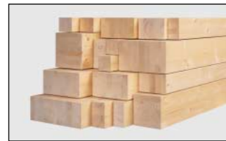
Brettschichtholz (BSH) parallel • Meisterholz

Die 1891 gegründete Unternehmensgruppe Hüttemann ist ein Familienunternehmen in der vierten Generation und an zwei Standorten in Deutschland vertreten.