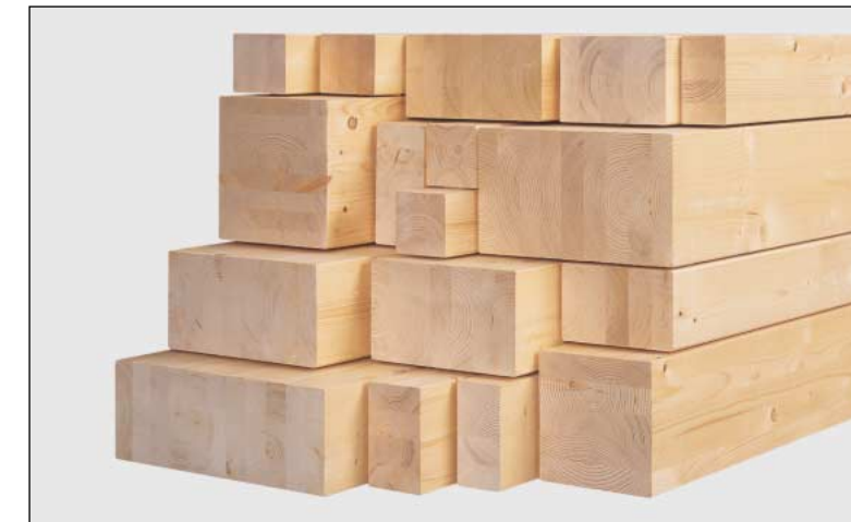
Sonderquerschnitte bis 24 m Länge