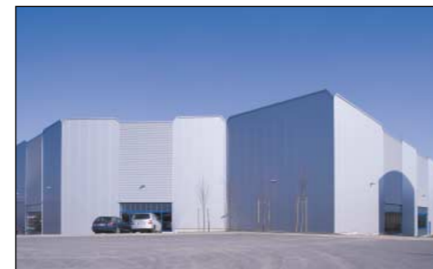
JDEHA · Iserlohn