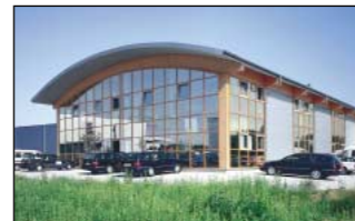
Schlüsselfertige Gesamtlösungen mit BSH • Kompletthallenbau